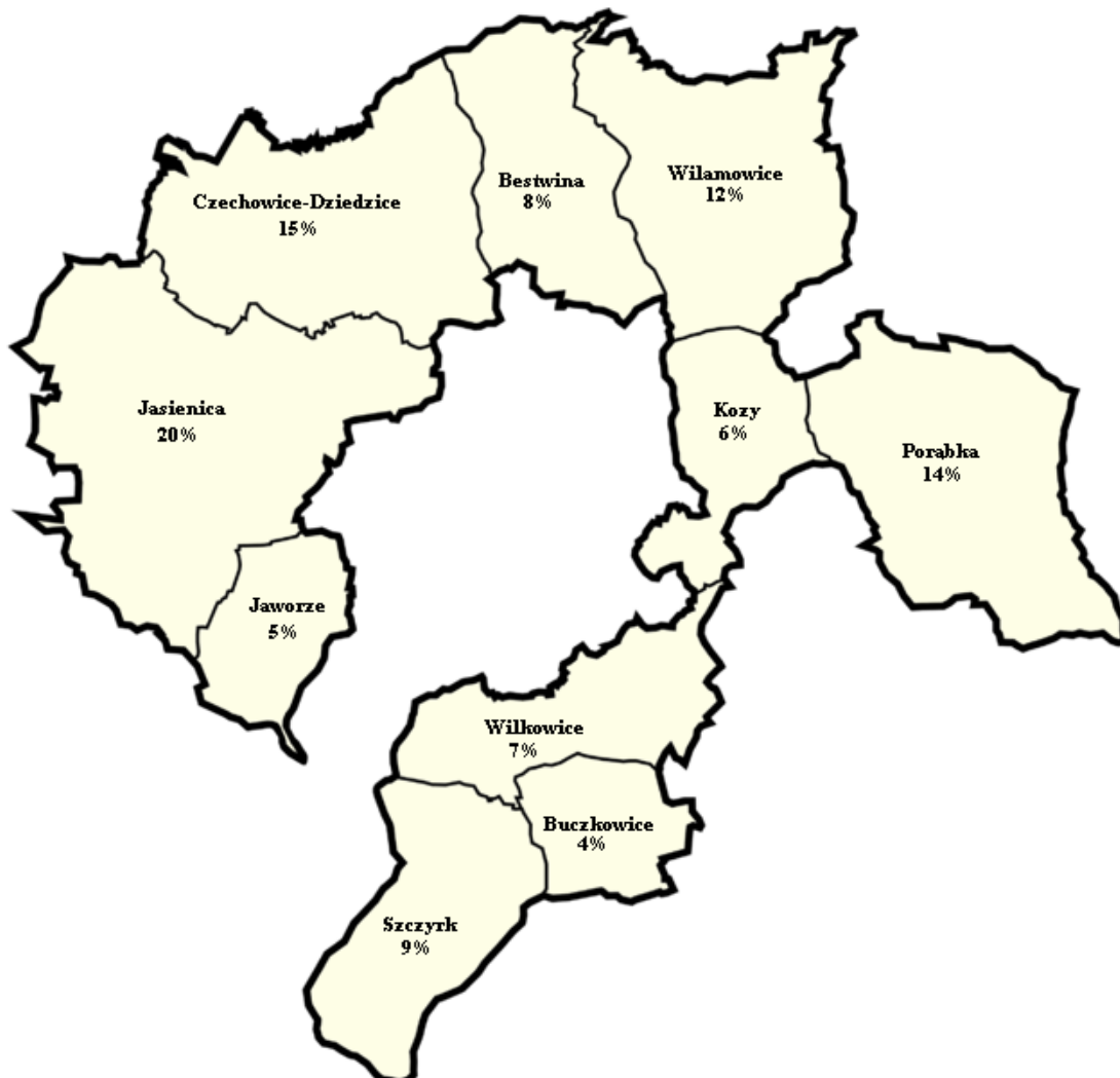
Mapa 3. Powierzchnia poszczególnych gmin na tle powiatu bielskiego.

Poniższe zestawienie prezentuje udział każdej z wymienionych gmin (w procentach) w powierzchni Powiatu Bielskiego ogółem.