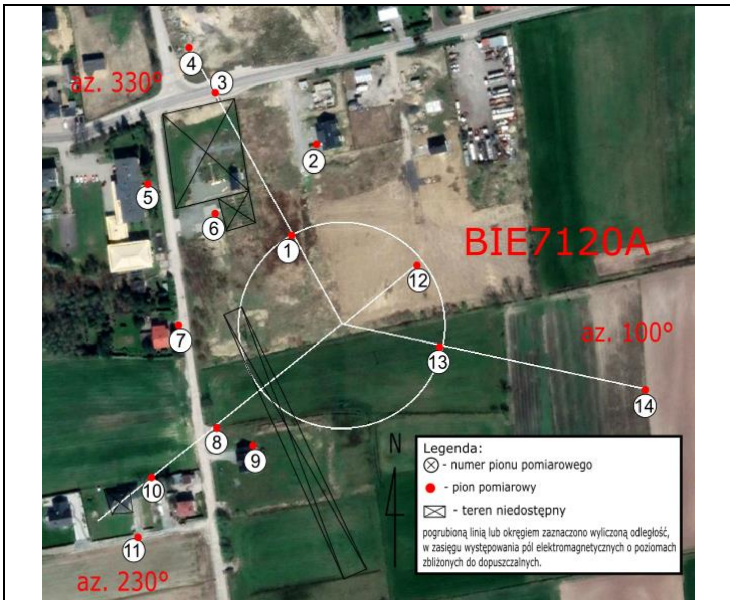
Zdjęcie satelitarne: Image © 2024 Google