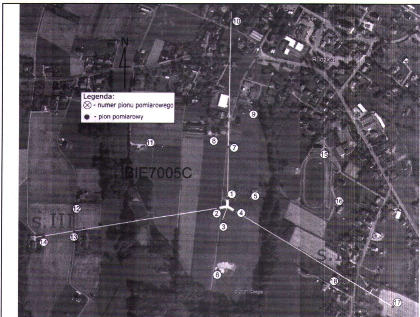
Zdjęcie satelitarne: Image © 2021 Google