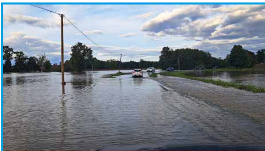
Ligota, ul. Ligocka