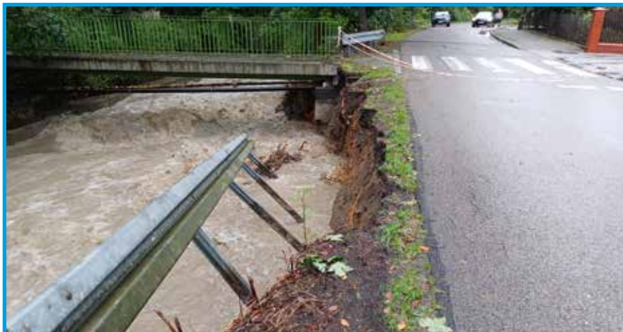
Jasienica, ul. Międzyrzeczka

tw. Racibórz Dolny, który zatrzymał falę wezbraniową. Władze samorządowe od wielu lat wnioskuje o utworzenie zbiornika retencyjnego w Międzyrzeczu,