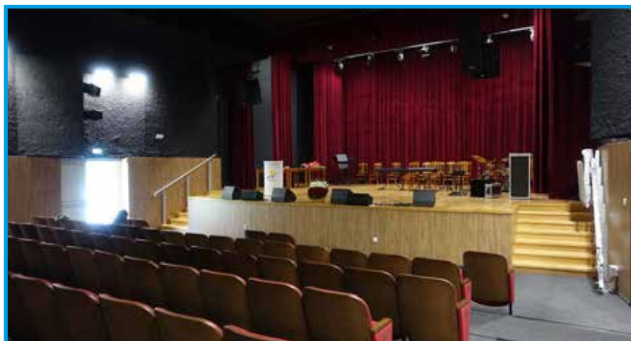
Nowoczesna sala widowiskowa

Powiat Bielski jest organem prowadzącym dla ZSS nr 4, ZSTiL, Liceum Ogólnokształcącego im. M. Skłodowskiej-Curie w Czechowicach-Dziedzicach oraz Powiatowego Zespołu Placówek SMS Szczyrk w Buczkowicach.