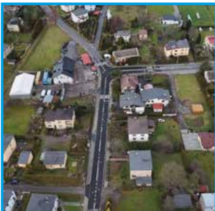
Ul. Sikorskiego w Zabrzeżu

Dokonano renowacji i udrożnienia rowów odwadniających na długości ok. 5 km oraz wykonano ścięcia poboczy drogowych na powierzchni 930 m 2 .