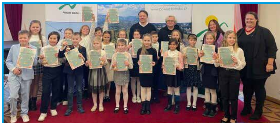
Laureaci konkursu recytatorskiego.

Gratulujemy wszystkim laureatom i życzymy dalszych sukcesów.