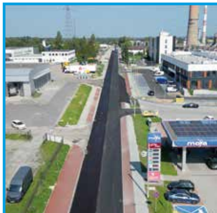
Ul. Legionów w Czechowicach-Dziedzicach