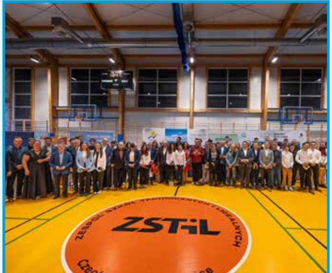
Pamiątkowe zdjęcie osób wyróżnionych podczas Spotkania Środowiska Sportowego