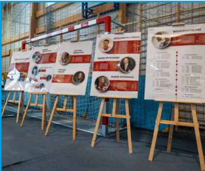
Wystawa przygotowana przez MKS Czechowice-Dziedzice prezentująca dorobek klubu i gminy Czechowice-Dziedzice