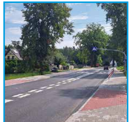
Ul. Oświęcimska w Dankowicach