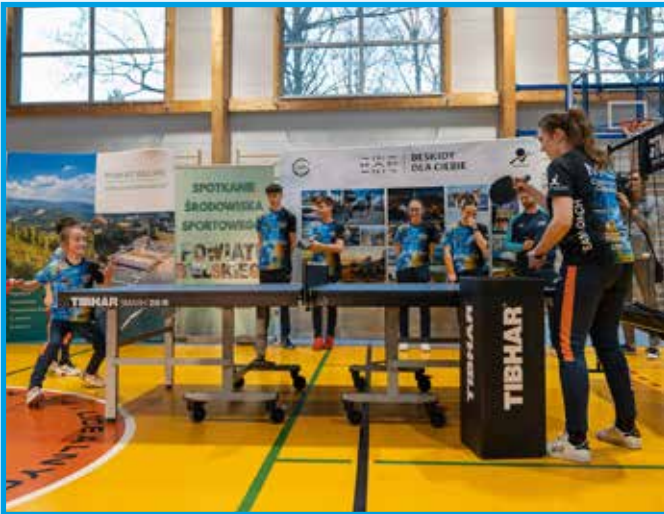
Pokaz tenisa stołowego w wykonaniu zawodników MKS Czechowice-Dziedzice