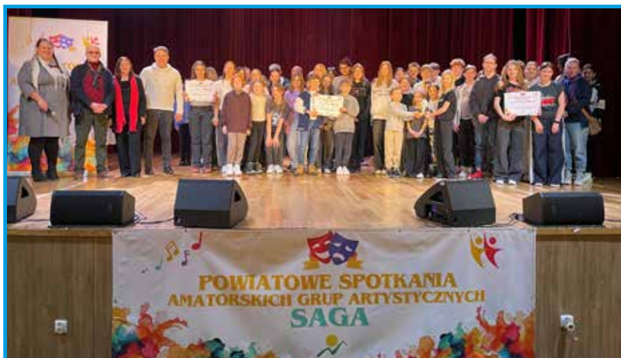
Jury oraz laureaci zespołów teatralnych

3 miejsce otrzymał Zespół Teatralny „Promyczek” z Gminnego Ośrodka Kultury „Promyk” w Bystrej oraz Grupa „VIVRE 3” z Gminnego Ośrodka Kultury w Jasienicy, wyróżnienie zdobył Teatrzyk Dzie-