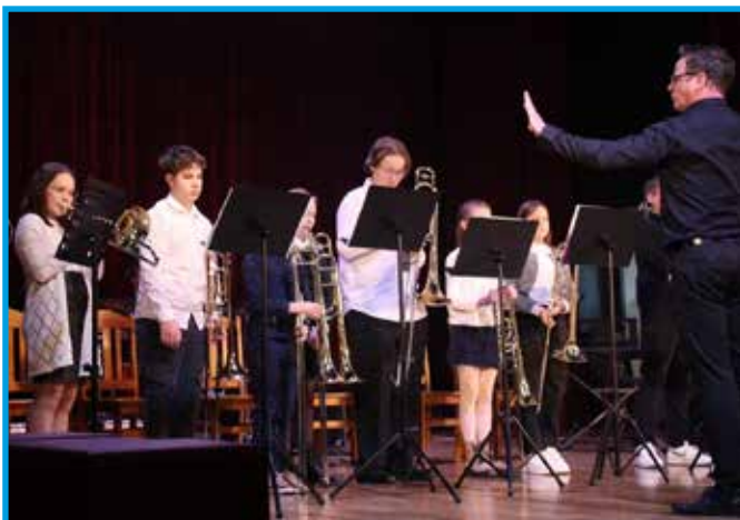
Występ Chóru Puzonowego z POPP „ART.” w Czechowicach-Dziedzicach

Dziękujemy raz jeszcze wszystkim osobom zaangażowanym w organizację SAGI'2025.