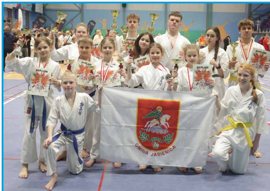
Karatecy na gali sportowej

W zawodach wystartowało 243 zawodników z 26 klubów, a reprezentacja Kasai, licząca trzynastu zawodników, wywalczyła 3 złote, 2 srebrne i 6 brązowych medali. Dzięki temu klub zajął wysokie 5. miejsce w klasyfikacji drużynowej,