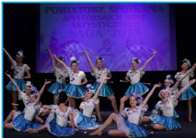
Występ Mażorettek NEMEZIS Juniorki z Miejsko-Gminnego Ośrodka Kultury w Wilamowicach