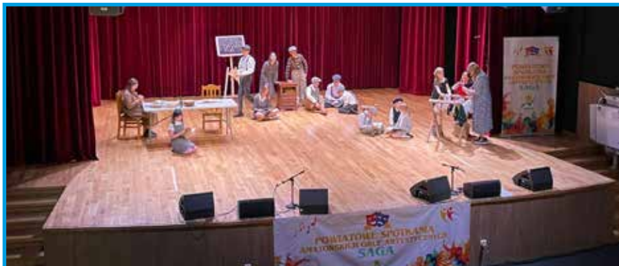
Występ Koła Teatralnego „Dzieci z pamiętnika” ze Szkoły Podstawowej nr 2 SPSK im. Jana Pawła II w Porąbce

Współczesnego „Vivre IV” z Gminnego Ośrodka Kultury w Jasienicy, 2 miejsce zdobył Zespół Taneczny Mażoretki „Gracja” z Miejsko-Gminnego Ośrodka Kultury w Wilamowicach.