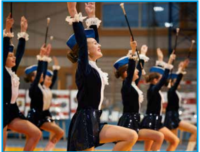
Mażoretki Gracja z Starej Wsi uświetniły galę pokazem artystycznym