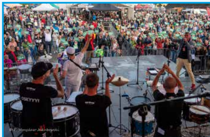
Publiczność bawiła się znakomicie