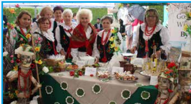
Koło Gospodyń Wiejskich z Bystrej