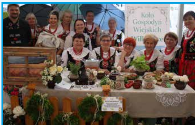
KGW Wilkowie wyróżnione przez redakcję Mojego Powiatu za wystrój stanowiska.