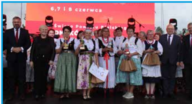
Laureatki przeglądu potraw regionalnych ze starostą.