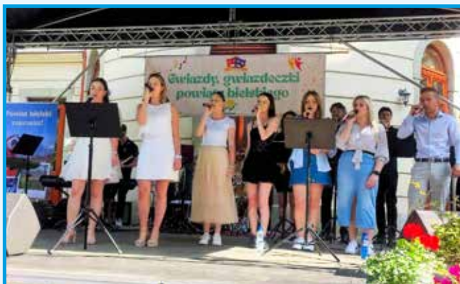
Big Band ZSTiL Czechowice-Dziedzice