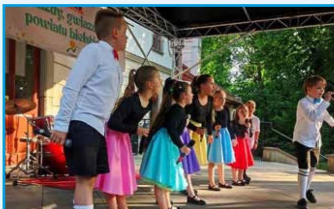
Zespół Wokalno-Taneczny „Włóczykije”