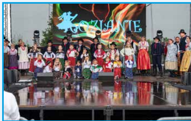
Zespół Pieśni i Tańca „Kozianie”.