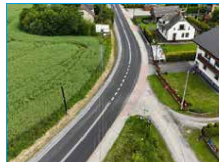
Wyremontowana droga w Zasolu Bielańskim

Wartość zadania: 1 052 634,48 zł, remont był współfinansowany