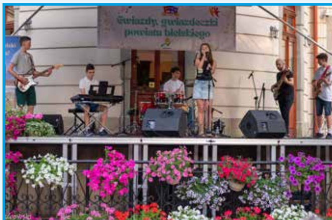
Gwiazdy, gwiazdeczki powiatu bielskiego czyli występ laureatów SAGA 2025.