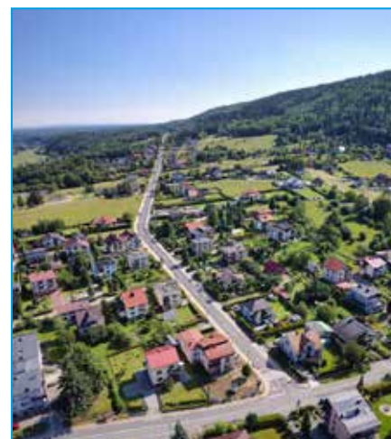
Wyremontowana droga w gminie Porąbka