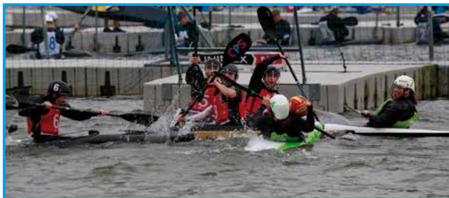
W trakcie zawodów