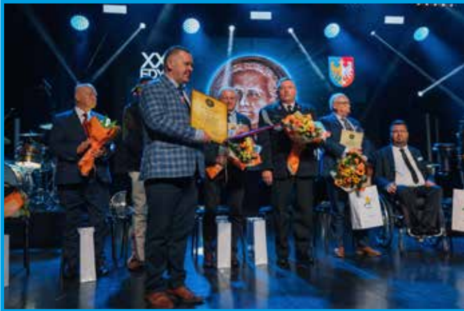
Laureat nagrody G. Gabor na scenie Bielskiego centrum Kultury