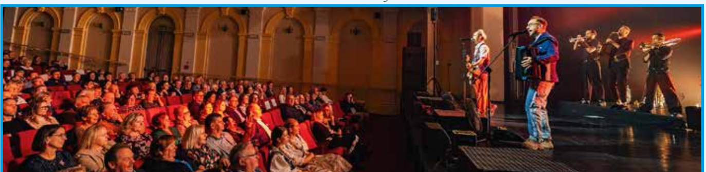
Artystyczną gwiazdą wieczoru był zespół Eney