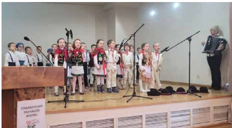
uroczy występ dzieci z przedszkola w Bystrej

Organizatorzy podziękowali wszystkim uczestnikom wydarzenia za obecność, wsparcie i życzliwe słowa. Jubileusz ponownie potwierdził, że troska o dziedzictwo naszej małej ojczyzny łączy ludzi i wzmacnia wspólnotę