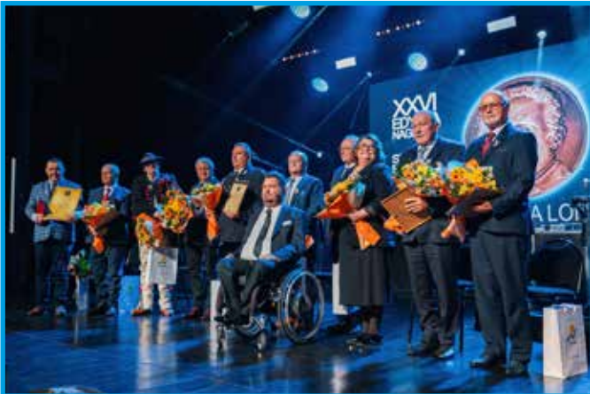
Wszyscy nominowani z 10 gmin wraz ze starostą bielskim