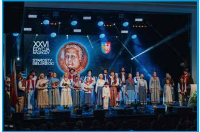
Zespół Regionalny Klimczok wykonujący patriotyczny repertuar