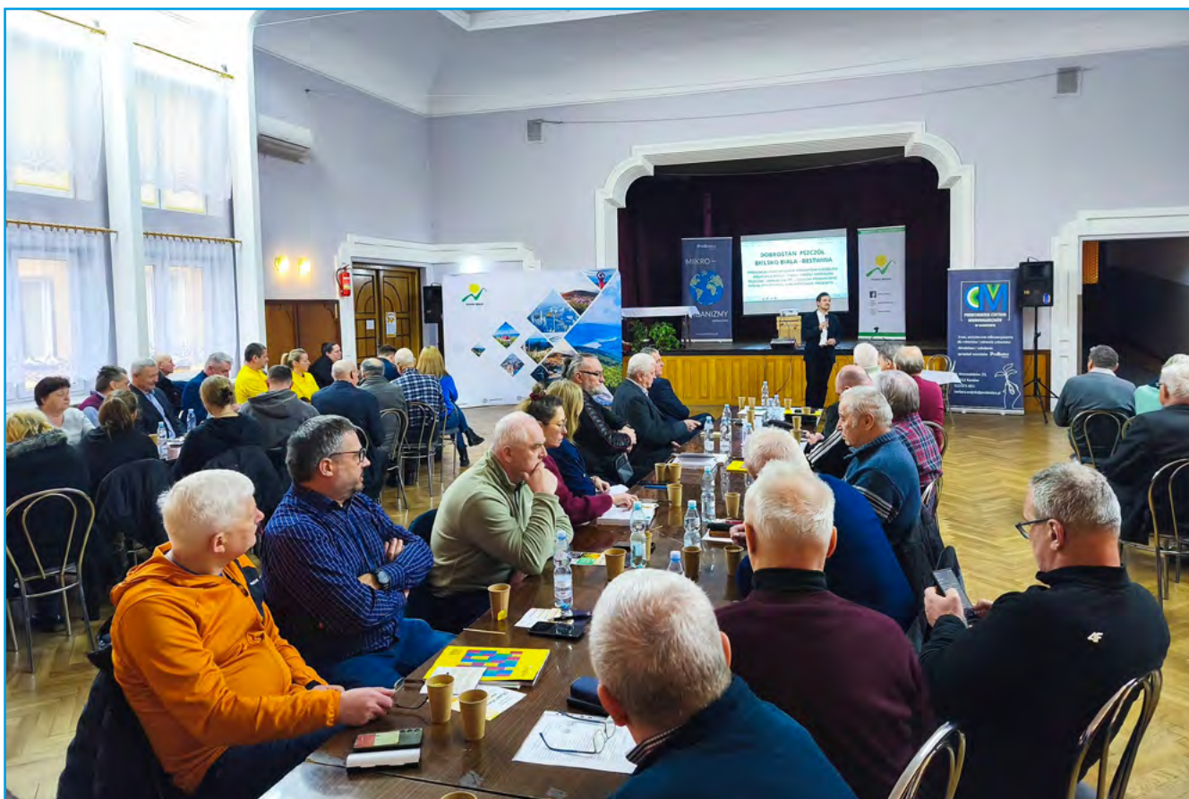
Uczestnicy szkolenia podczas prelekcji

7 lutego w sali przy OSP Bestwina odbyło się II Powiatowe Szkolenie pt. „Dobrostan Pszczoł”.