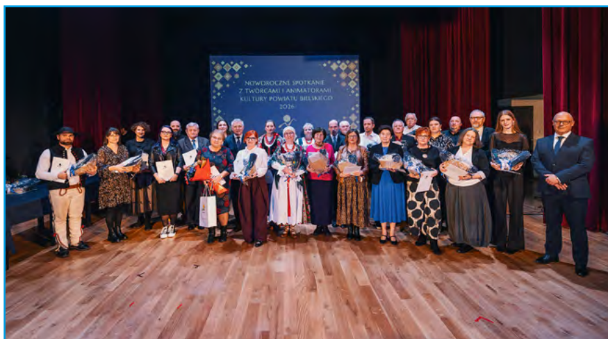
Wyróżnieni animatorzy i twórcy z władzami powiatu bielskiego