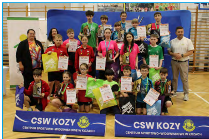
Wszyscy nagrodzeni zawodnicy turnieju

Organizatorzy zapowiedzieli także, że chcą kontynuować zawody w nowej formie – Powiatowej Ligi Tenisa Stołowego. Będzie to już trzecia liga organizowana przez Powiat Bielski – dotychczas młodzi sportowcy z powiatu mogli brać udział w Powiatowej Lidze Pływackiej oraz Powiatowej Lidze Szachowej.