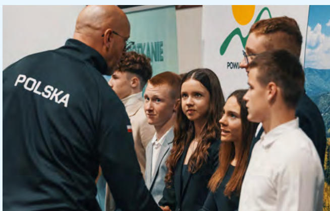
Minister Sportu i Turystyki Jakub Rutnicki wręczający medale wyróżnionym sportowcom