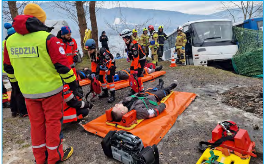
XX Międzynarodowe Zimowe Mistrzostwa Polski w Ratownictwie Medycznym

– W naszej pracy codziennie coś nas zaskakuje, nigdy nie wiemy tak naprawdę, do czego jedziemy. Najważniejsze jest, by opanować emocje i wykorzystać wie-