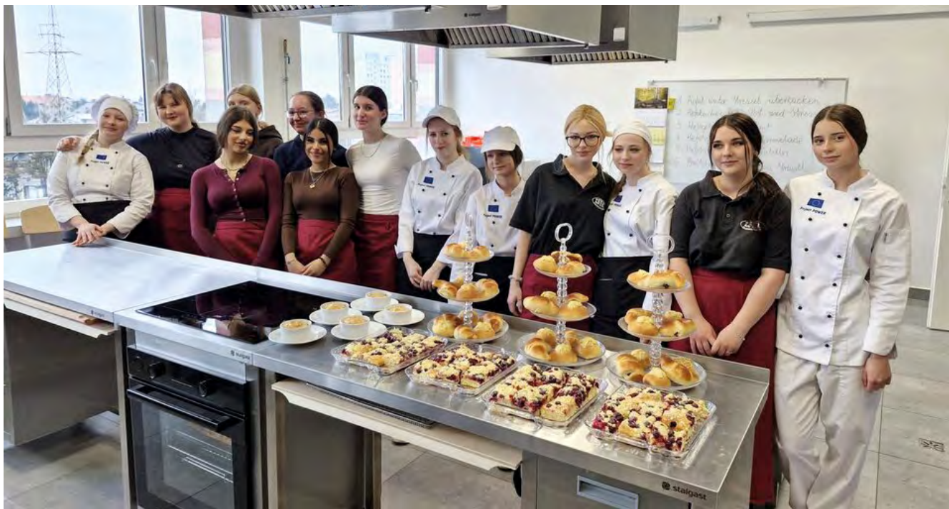
Warsztaty kulinarne w Zespole Szkół Technicznych i Licealnych

W ramach międzynarodowej wymiany uczniowie z partnerskiego powiatu Rhein-Erft w Niemczech odwiedzili 18 marca 2026 r. Starostwo Powiatowe w Bielsku-Białej. Wizyta została zorganizowana we współpracy z Zespołem Szkół Technicznych i Licealnych w Czechowicach-Dziedzicach i stanowiła ważny element rozwijania kompetencji międzykulturowych oraz budowania relacji między młodzieżą.