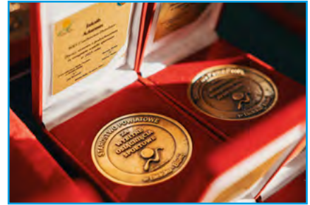
Medale dla wyróżnionych sportowców

Starostwo Powiatowe w Bielsku-Białej zachęca najmłodszych mieszkańców do aktywności sportowej, stwarzając im możliwości sprawdzenia swoich umiejętności. Co roku, przy współudziale klubów i gminnych ośrodków sportu, organizuje wydarzenia takie jak: Powiatowa Liga Szachowa, Powiatowa Liga Pływacka, impreza sportowo-