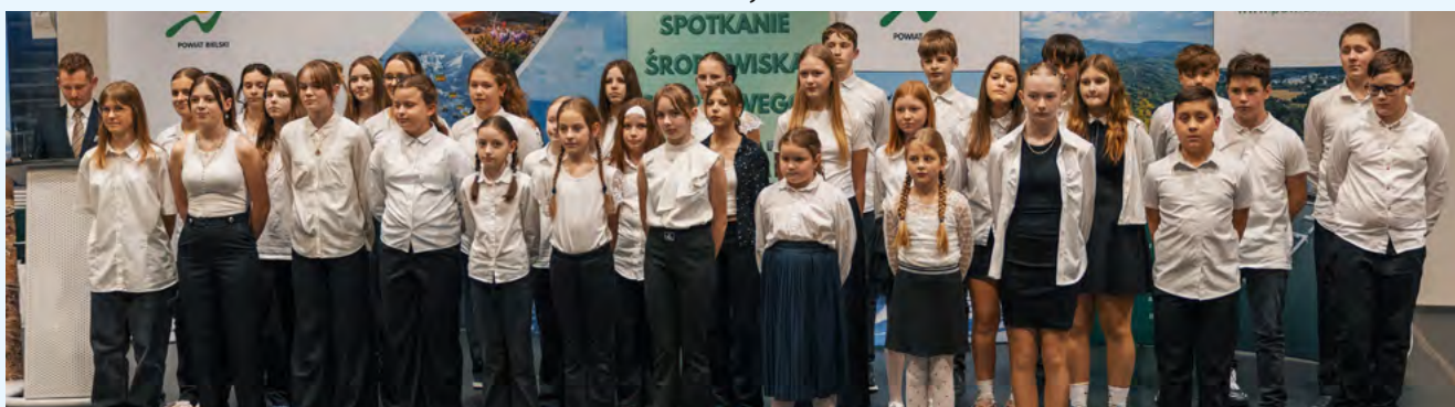
Występ chóru szkolnego ze Szkoły Podstawowej w Kalnej