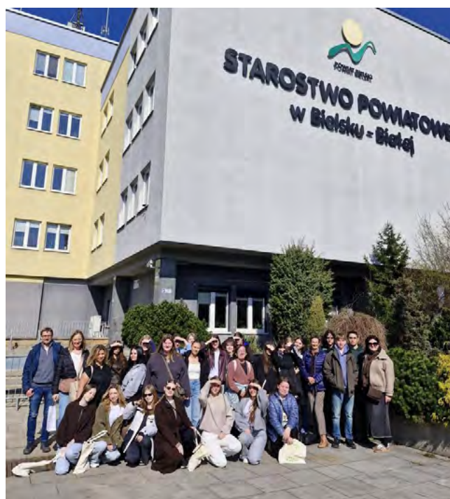
Uczestnicy wizyty przed budynkiem Starostwa Powiatowego w Bielsku-Białej

Realizacja przedsięwzięcia była możliwa dzięki wsparciu finansowemu Powiatu Bielskiego oraz Polsko-Niemieckiej Współpracy Młodzieży w Warszawie, które od lat wspierają wymianę uczniowską partnerskich szkół.