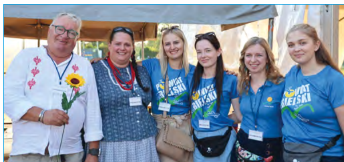
Wydział Promocji Powiatu, Kultury, Sportu i Turystyki

Życzymy Ci dużo zdrowia, spełnienia marzeń oraz wielu pięknych chwil na nowym etapie życia. Niech emerytura będzie dla Ciebie czasem odpoczynku, realizacji pasji i radości z codzienności.