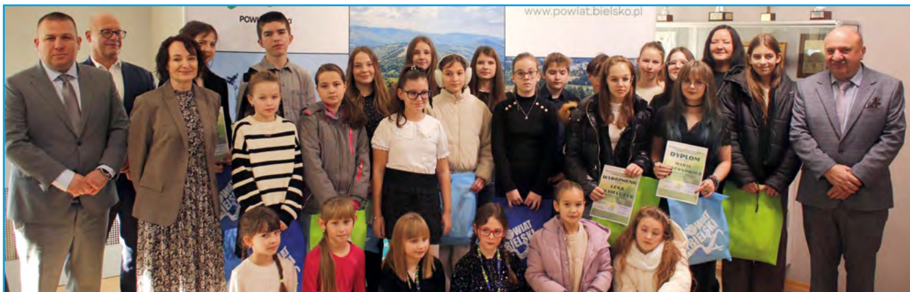
Nagrodzeni w konkursie razem z Zarządem Powiatu oraz Radnymi Rady Powiatu w Bielsku-Białej

10 grudnia podsumowaliśmy XXII edycję Powiatowego Konkursu Ekologicznego „Człowiek a środowisko”.