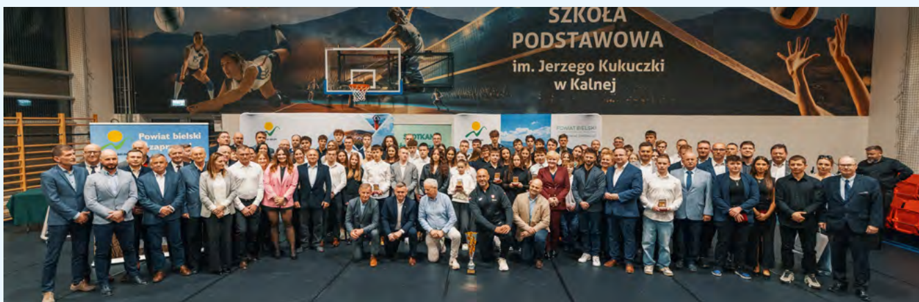
Uczestnicy Spotkania Środowiska Sportowego Powiatu Bielskiego