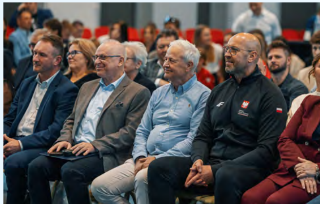
Od lewej Radny Rady Powiatu Leszek Obracaj, Starosta Bielski Andrzej Płonka, Poseł na sejm RP Apoloniusz Tajner, Minister Sportu i Turystyki Jakub Rutnicki