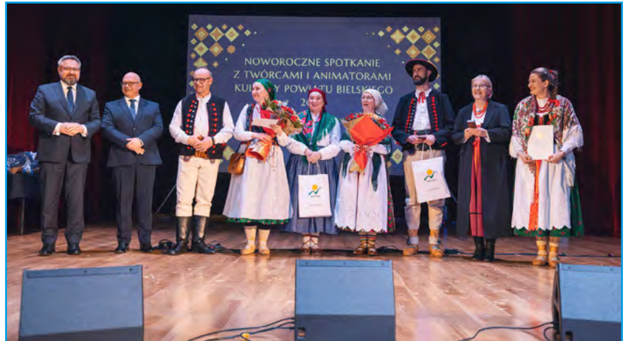
Nagrodzeni przez Ministra Kultury i Dziedzictwa Narodowego

– Regionalny Zespół Bierowianie – z okazji jubileuszu 40-lecia działalności, za zasługi w upowszechnianiu kultury ludowej,