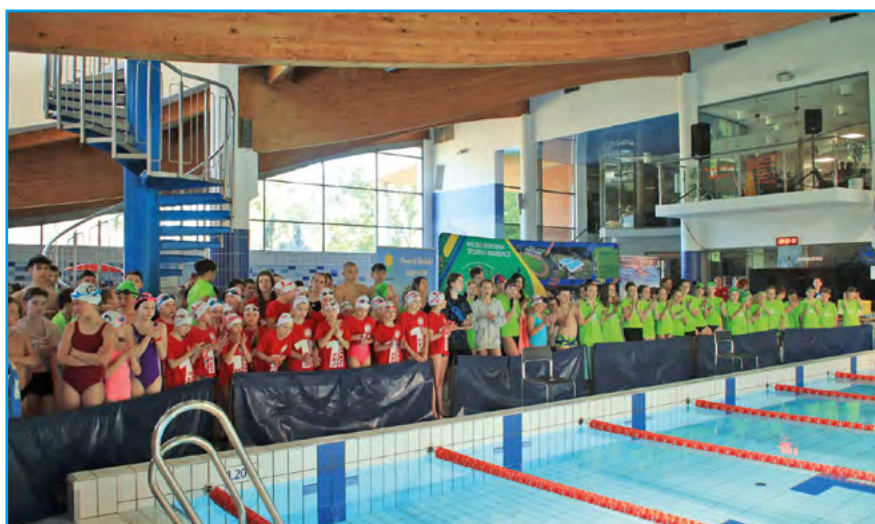
Wszyscy uczestnicy ligi pływackiej wraz z opiekunami

W klasyfikacji drużynowej zwyciężyła Szkoła Podstawowa nr 1 w Czechowicach-Dziedzicach. Drugie miejsce zajęła Szkoła Podstawowa nr 2 w Kozach, natomiast trzecie miejsce zajęła Szkoła Podstawowa nr 1 w Szczyrku.