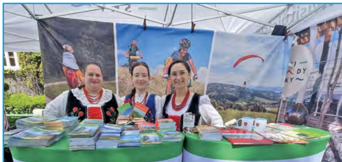
Promocja powiatu bielskiego na stoisku

To był czas spotkań, muzyki i prezentacji walorów naszego powiatu. Wydarzenie pozwoliło jeszcze szerzej pokazać, czym wyróżnia się nasz region.