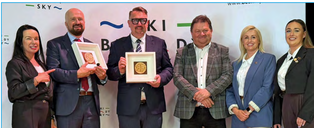
Przedstawiciele władz samorządowych wraz z dyrektorem Euroregionu Beskidy podczas jubileuszu

Wydarzenie było okazją do podsumowania ponad 25 lat współpracy transgranicznej, wspólnych inicjatyw oraz konsekwentnego budowania relacji ponad granicami. Przypomniano początki współpracy, jej rozwój na przestrzeni