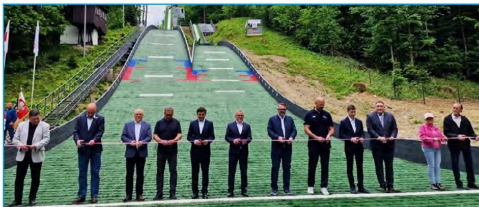
Przedstawiciele władz na uroczystym otwarciu skoczni w Bystrej

Kompleks skoczni na stoku Koziej Góry w Beskidzie Śląskim powstał na początku lat 70. XX wieku. Początkowo