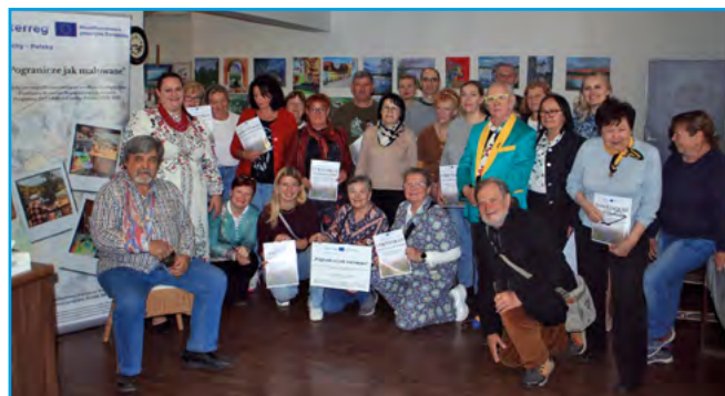
Uczestnicy Obozu Artystycznego Pogranicze jak malowane w Czechach

To ostatnie działanie w ramach realizowanego przez Powiat Bielski oraz Spolek Mlejn z Ostrawy projektu współfinansowanego przez Unię Europejską w ramach Programu INTERREG Czechy-Polska 2021-2027. Jego celem głównym było nawiązywanie nowych partnerstw między mieszkańcami z obszarów, które jeszcze nie współpracowały, wzmacnianie poczucia przynależności i wzajemnego zrozumienia, wzmacnianie tożsamości mieszkańców Euroregionu Beskidy oraz nawiązywanie kontaktów interpersonalnych i wymiana doświadczeń w obszarze kultury i sztuki.