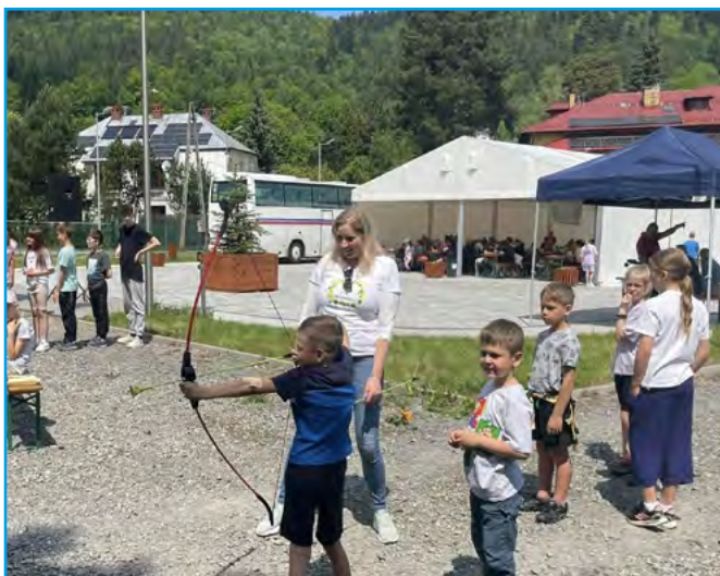
Strzelanie z łuku przez uczestników rajdu

Przy sprzyjającej, słonecznej pogodzie miłośnicy górskich wędrówek przemierzali beskidzkie szlaki, aktywnie spędzając czas i podziwiając uroki regionu.