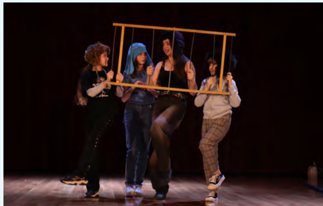
Jeden z zespołów teatralnych dzieci i młodzieży szkolnej