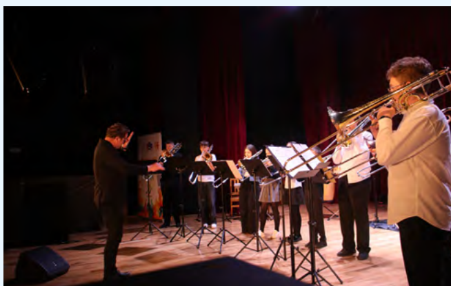
Tercet Trevia występuje na scenie