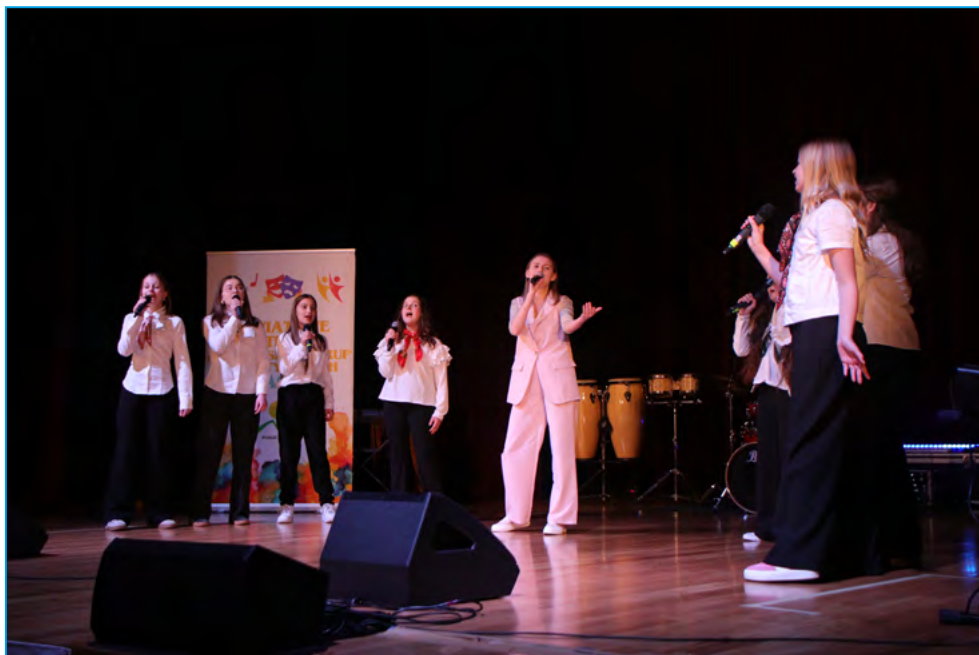
Występ zespołu wokalnego z Kalnej

– Jako organizatorzy i jurorzy cieszymy się, że w tym roku wystąpiło w niej ponad 1000 osób, dzieci i młodzieży. Jest to absolutny rekord SAGI i pozostaje się tylko cieszyć z rozwoju ruchu artystycznego na terenie powiatu bielskiego. To były piękne dni i były świętem organizatorów, występujących zespołów i wszystkich widzów, którzy w tym uczestniczyli – powiedziała