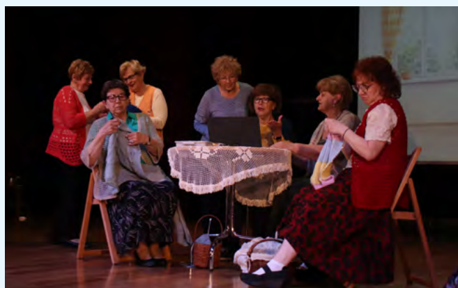
Seniorki w akcji podczas spektaklu