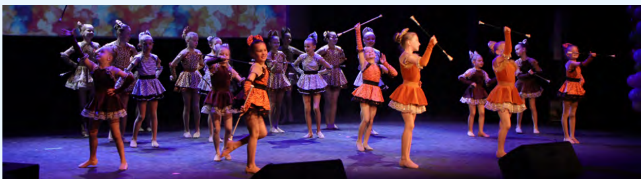
Grupa mażorettek na scenie MDK w Czechowicach-Dziedzicach