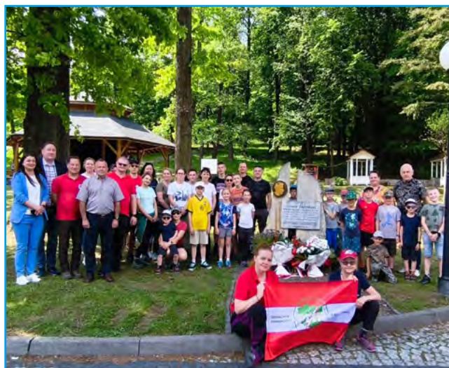
Uczestnicy rajdu wraz z organizatorami oraz przedstawicielami władz samorządowych przy pomniku poświęconym Ignacemu Daszyńskiemu

W trakcie rajdu wyróżniono również najmłodszych uczestników, podkreślając ideę dostępności górskich wędrówek dla wszystkich pokoleń. Najliczniej reprezentowaną szkołą był