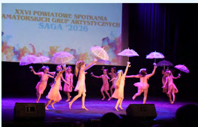
Młode tancerki prezentują układ