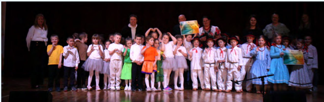
Przedszkolaki podczas wręczenia nagród