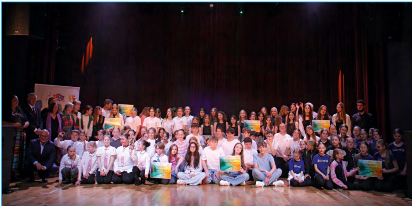
Członkowie zespołów muzycznych wraz z jury konkursu

Te liczby mówią same za siebie: prawie 1100 uczestników, łącznie 61 zespołów, w tym: 10 zespołów teatralnych, 5 zespołów folklorystycznych, 6 zespołów mażorettek, 20 zespołów tanecznych i 20 zespołów muzycznych. XXVI Powiatowe Spotkania Amatorskich Grup Artystycznych SAGA 2026 dobiegły końca, zgromadzając rekordową jak dotąd liczbę uczestników i zespołów biorących w nich udział!