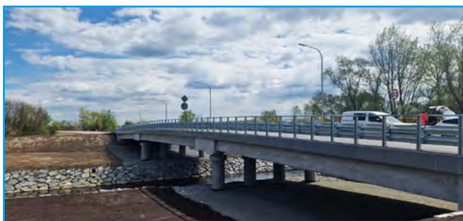
Nowy odcinek drogi i most w Kaniowie

W przyszłości te tereny oraz obszary wokół lotniska mogą być jeszcze efektywniej wykorzystane gospodarczo, co przełoży się na zwiększenie popytu na usługi lokalnych przedsiębiorców, wzrost wpływów z podatków oraz zatrudnienia – mówi wicestarosta Fajfer.