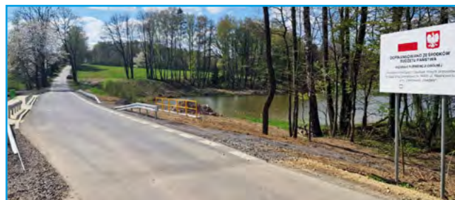
Odcinek drogi powiatowej przy ulicy Mazańcowickiej w Czechowicach-Dziedzicach, przepust

Wśród najważniejszych robót znalazły się: rozbiórka dwóch starych przepustów i wybudowanie w ich miejscu nowych, przebudowa nawierzchni fragmentu drogi, a także budowa chodnika po jednej stronie ulicy oraz utwardzonego pobocza po drugiej. Ponadto przeprowadzono regulację