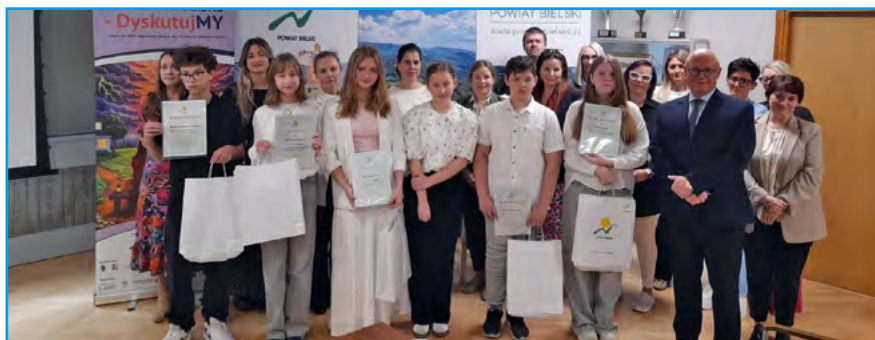
Uczestnicy „Po prostu blisko” – Dyskutuj-MY wraz z organizatorami

Projekt „Po prostu blisko” – DyskutujMY jest efektem potrzeb zgłaszanych przez szkoły, rodziców i specjalistów. Będzie ukierunkowany na wzmocnienie kompetencji wychowawczych rodziców i budowaniu zdrowych relacji rodzic – dziecko, ze szczególnym uwzględnieniem uczniów klas V–VIII szkoły podstawowej.