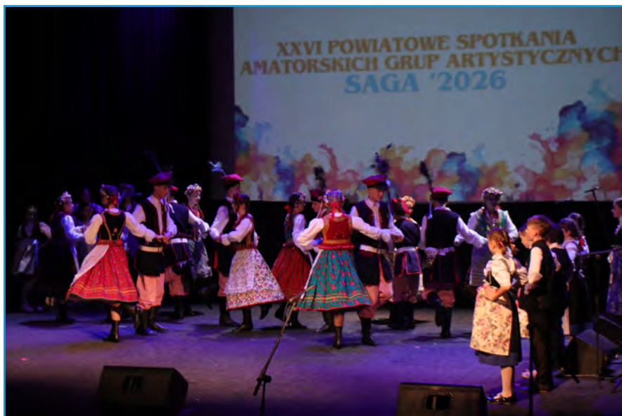
Zespół Folklorystyczny Granica