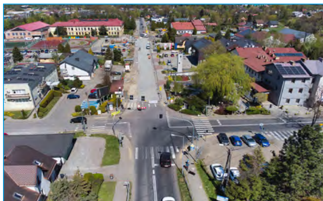
Rozbudowa drogi powiatowej przy ulicy Strumieńskiej w Jasienicy

– Praktycznie gotowy już jest fragment położony bliżej miejscowości Rudzica. Z kolei w okolicy urzędu gminy wykonano roboty rozbiórkowe i ziemne, a prace koncentrują się obecnie na infrastrukturze podziemnej oraz stabilizacji podłoża. Przebudowywany jest parking przy szkole, prowadzone są także prace związane z budową kanalizacji – informuje starosta Płonka (klub